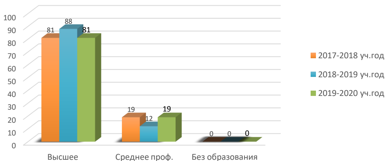
Анализ педагогических кадров по образованию /%

Педагоги награждены отраслевыми и ведомственными наградами: